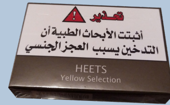
السجائر المُسخَّنة في إسرائيل