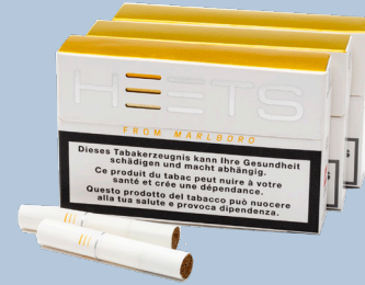
الاتحاد الأوروبي (ألمانيا)